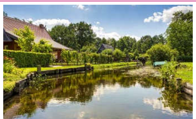
Dahme-Spreewald Wasserkanal im Spreewald